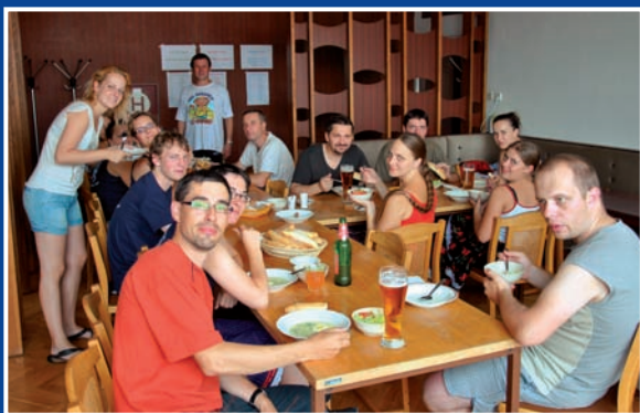
▼ Soustředění chasy v Hluku