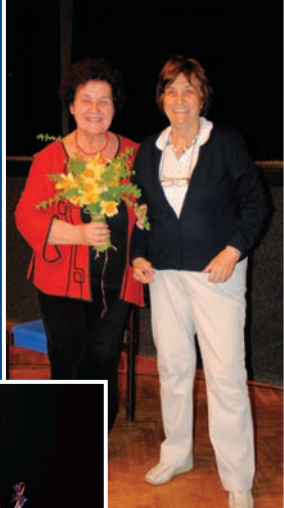
Velikonoční beseda v Krůžku