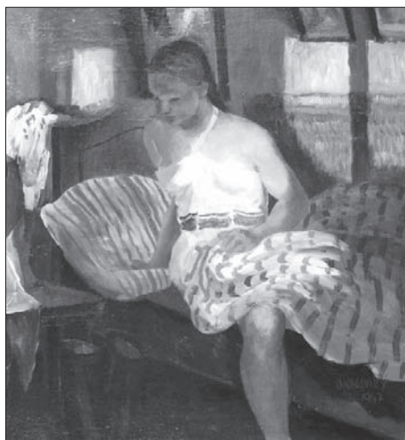
Dívka ráno od B.O.

keré se Bohdan rychle naučil, táta byl vždy výtečným zpěvákem.