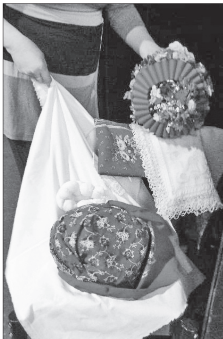
„Pantlák“ hanácké nevěsty, úvaz hanáckého šátku – okolí Přerova

Šátek, turecký (bílý, původně sloužily jako ubrusy při čajových a kávových dýchánkách v maloměstském prostředí) nebo lipský (červený, převažoval od druhé čtvrtiny 19. století), se uvazoval na mnoho způsobů a jeho úvaz se