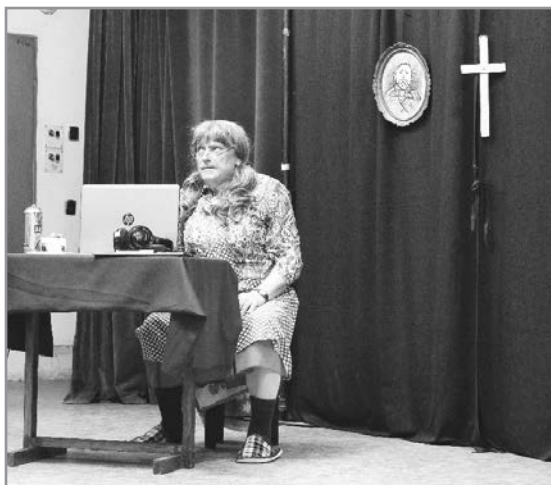
Z divadelní autorské hry Hašíš Bába z Monte Bú ..