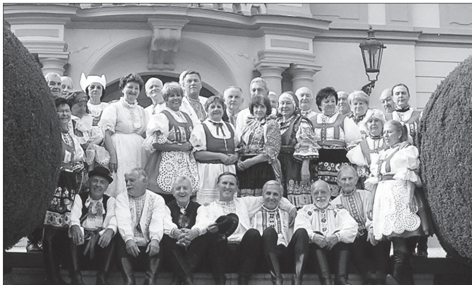
Slovácký krúžek v Bratislavě a Skaličané na krajanském festivalu v Praze v létě 2016